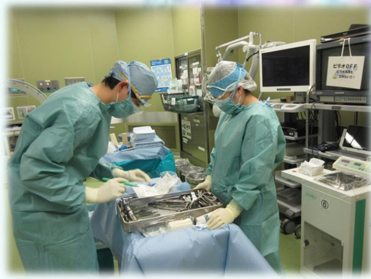
ガウンテクニック