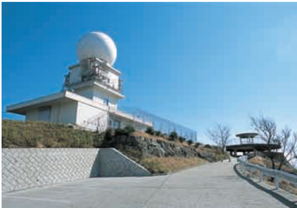
灰ヶ峰気象レーダー