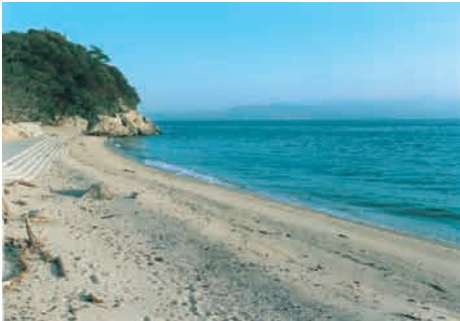
斎島の南側に広がる真名板(まないた)海岸