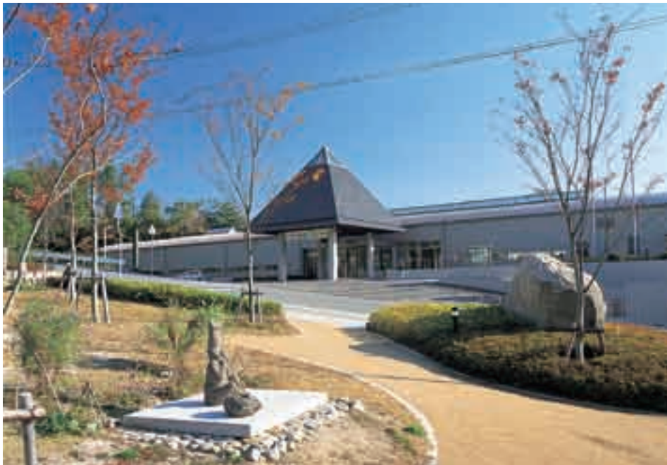
筆の里工房（熊野町）